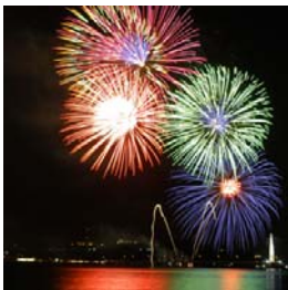
福山市花火大会 当院屋上開放します！